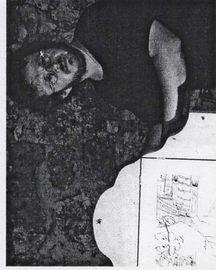
Pripovjedač izmjenjuje ilustrirane podloške u drvenom okviru

Nikada nisam ni u snu mogao zamisliti da ću jednom biti suorganizator nekog kulturnog događaja u Funtani, a ovih sam dana bio dio onikog fantastičnog festivala koji je okupio vršne kamishibai pripovjedače. Na BOOKtigi 2015. godine,